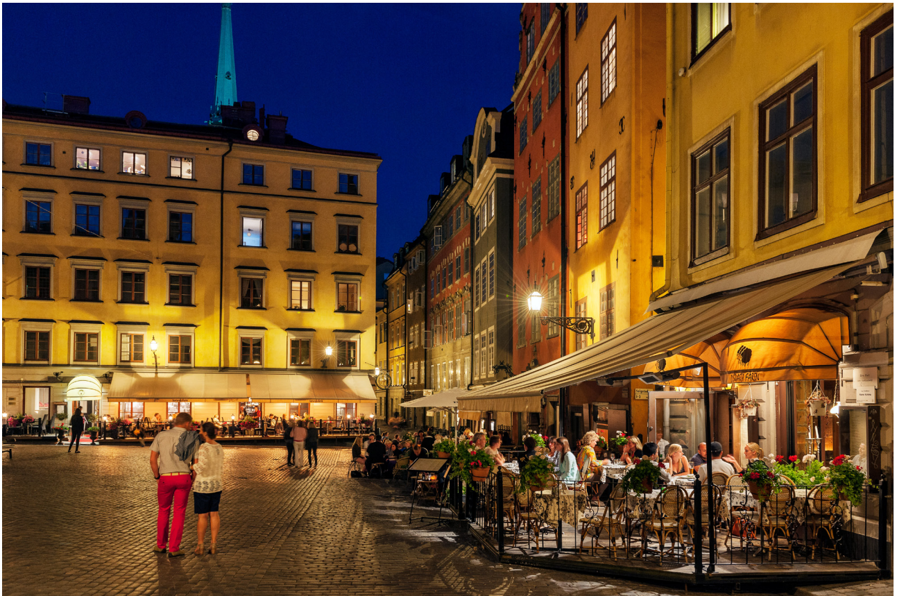
Foto: Stortorget, Gamla Stan